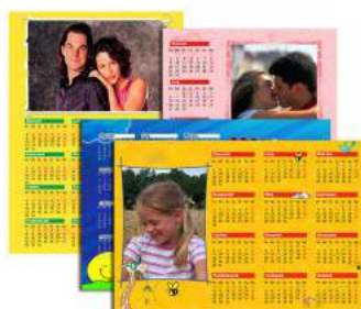
nr. 1 i nr. 2