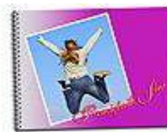
FOTO KSIĄŻKA w formacie 25x33

Dwustronny druk cyfrowy na papierze 160g/m 2 , okładka drukowana, twarda lub z wypełnieniem piankowym, laminowana folią błyszczącą.