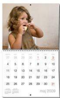
nr. 3, 4, 5, 6