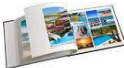
FOTO KSIĄŻKA w formacie 30x42

Dwustronny druk cyfrowy na papierze 160g/m 2 , okładka drukowana, twarda lub z wypełnieniem piankowym, laminowana folią błyszczącą.