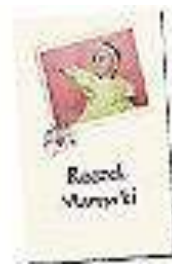
FOTO KSIĄŻKA w formacie 10x15 , 15x21 pionowa lub pozioma spiralowana

Dwustronny druk cyfrowy na papierze 300g/m 2